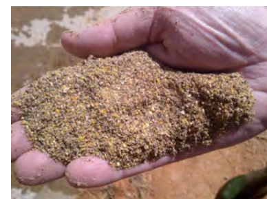
Figura 5: Presentación demasiado fina