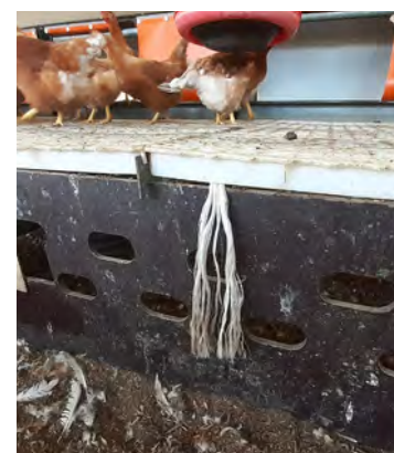
Figura 11: Cuerdas blancas en la nave de puesta