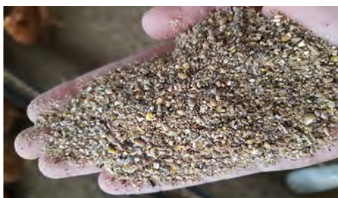
Figura 4: Buena presentación