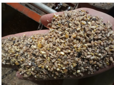
Figura 3: Presentación demasiado grosera