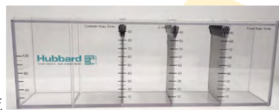
Figura 12: Criba alimento Hubbard

>> Los porcentajes muestran una guía de la cantidad de tamaño de partícula para cada categoría después de cribar con tamices de 3, 2 y 1 mm como los de la criba de Hubbard. Es importante para todas las raciones que el porcentaje de alimento que pase a través del tamiz de 1mm no exceda las cantidades mostradas.