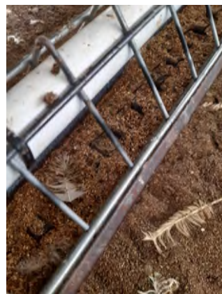
Figura 7: Tubo dentro de las rejillas