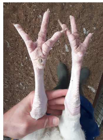
Figura 10: M99 estado de las patas