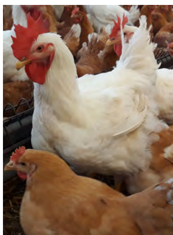
Figura 9: Buena actitud M77