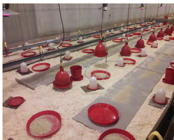
Figura 1: Buenas condiciones de cría

>> Por favor consultar la página Web de Hubbard o a su Referente técnico local de Hubbard y obtener el "Poster de Cría" Hubbard para más detalles específicos.