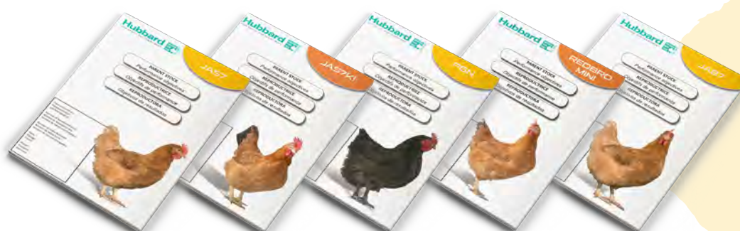
Objetivos de resultados JA57 - JA57Ki - P6N - REDBRO MINI - JA87