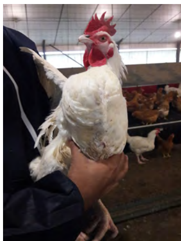
Figura 8: M99 estado de la pechuga

>> La observación y examen del macho es crucial para evaluar su condición (ver abajo Figuras 8, 9, 10).