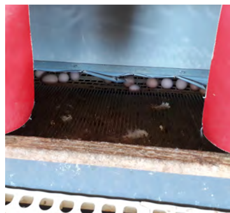
Figura 6: Manejo del nidal

>> Comprobar diariamente la presencia de aves que no produzcan desde el pico de puesta en adelante. Aislar a las gallinas cluecas lejos de los nidos en un corral con agua y alimento durante una semana. Por favor referirse al Boletín Técnico: "Cluecas".